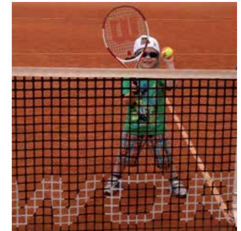
Die „jüngsten“ Schlägerhelden starten im Alter von 4