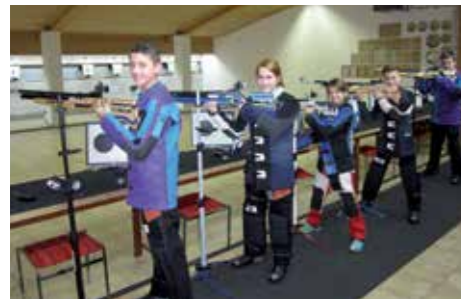
Die Sportschützen und ihr Junior-Team freuen sich auf dich. Komm einfach zum Schnuppertraining vorbei.

Neue Jungschützinnen und Jungschützen (ab 10 Jahren) sind jederzeit beim Training willkommen.