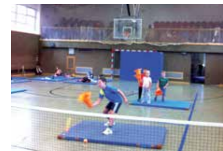
Koordinationsübungen in der Halle