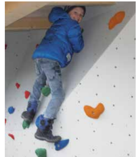
Die Begeisterung darüber ist riesengroß.

Die Baukosten belaufen sich auf ca. 43.000,- Euro. Die Gemeinde hat gute Hoffnung, eine Sportförderung vom Land Tirol zu erhalten.