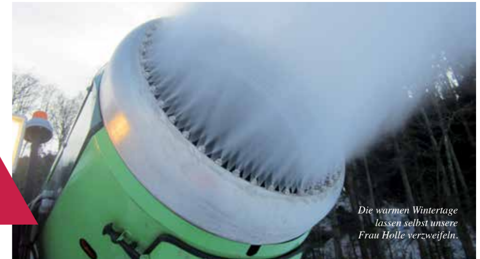
Die warmen Wintertage lassen selbst unsere Frau Holle verzweifeln.

Skiwelt-Saisonkarten gelten auch für den Kleinschlepplift Litzl. Kinder bis 6 Jahre fahren bei uns frei.