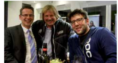
Beste Laune herrschte bei Sebi, Poitl und Alex vor.