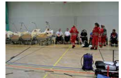
Patienten - Sammelplatz im Turnsaal

Auf Grund der Größe des Gebäudes werden regelmäßig Übungen zusammen mit der Brandschutztruppe und dem Personal des Reha-Zentrums durchgeführt.