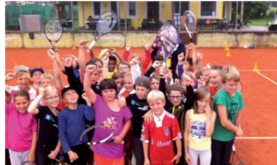
Schnuppern: die beste Möglichkeit Tennis mal auszuprobieren.