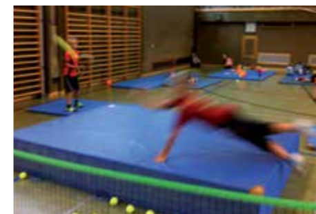
Fliegende Tennisspieler gibt's nur in Häring

Mit insgesamt 108 Kindern der Volksschule und 72 Kiddies des Kindergartens veranstaltete das TEAM T kostenlose Schnuppertennistage im Juli, von Mai bis September spielten 49 Kids wöchentlich beim „Juniors Day“ am Samstag vormittag, zusätzlich fanden 4 Sommercamps mit insgesamt 33 Kindern und Jugendlichen statt und 26 begeisterte Nachwuchsspieler trainieren aktuell im Wintertraining. Das ergibt insgesamt 285 Kids und Juniors, die im Jahr 2014 vom TC Raika Bad Häring in verschiedensten Initiativen, Schnupper-, Sportanimationsprogrammen oder beim Tennistraining betreut wurden.