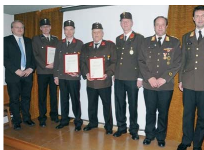
Die Geehrten der FF Angath.