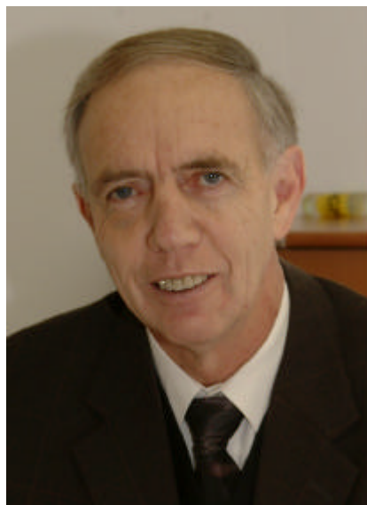
Bürgermeister Georg Karrer

Kinderspielplatzes in Unterlangkampfen möchte ich Folgendes mitteilen: