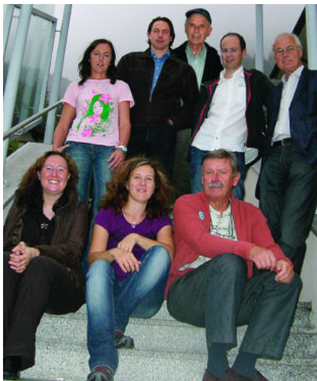
Das engagierte Team der Bürgerinitiative Langkampfen

Dieses neu erstellte Lärmgutachten führte dazu, daß das Computer-Rechenmodell der Lärmimmissionen (als Grundlage für die Trassenplanung durch die BEG) um den Wert von +3dB(A) korrigiert werden mußte.