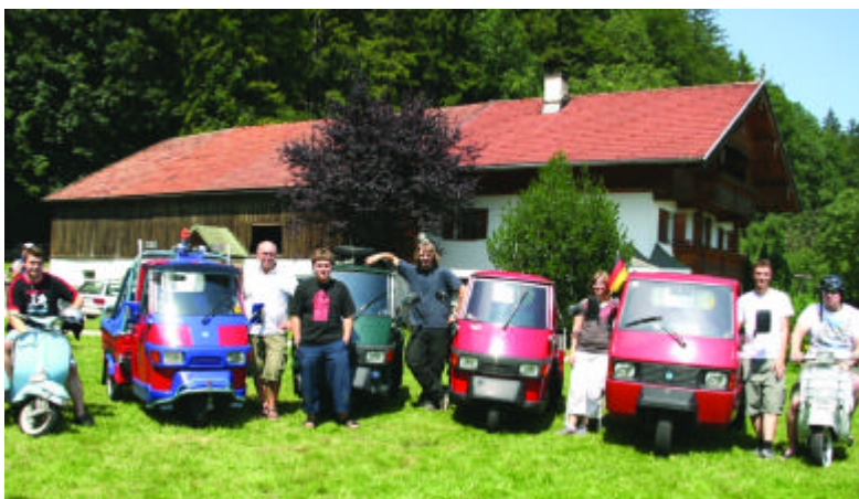
Die Fans der italienischen Fahrzeuge trafen sich in Langkampfen.