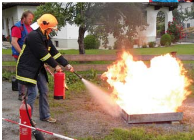
Die Feuerwehr freute sich über den regen Besucherandrang beim Sicherheitstag

gen der Samariterbund-Hundestaffel auf dem Programm. Unterstützt wurde die Feuerwehr Kirchbichl von der Firmen Felbermayr, ARBÖ, Zivil- & Katastrophenschutz, Abschleppdienst Greiderer und Samariterbund, welche ebenfalls ihren Fuhrpark zur Schau stellten und ihr Wissen an die zahlreich erschienen Besucher weitervermittelten.