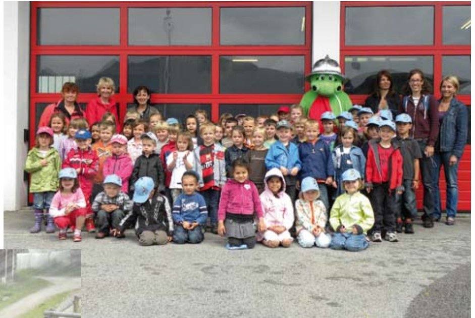
„Grisu“ umringt von seinen kleinen Freunden

Mitte Juni düsten die Kleinen des Kirchbichler Kindergartens mit dem knallroten Feuerwehrauto zum nahegelegenen Spritzenhaus. Dort angekommen konnten Fahrzeuge und Geräte aus nächster Nähe bestaunt sowie Helme und Jacken anprobiert werden. Groß war die Aufregung bei den Kindern als ihnen anhand von Brandsimulationen die Gefahren, welche von ei-