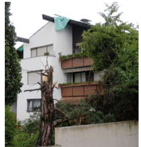
Objekt Bruggerstraße 2

Traurige Bilanz des Unwetterereignisses: Im gesamten Gemeindegebiet entstanden an 37 Objekten Schäden.