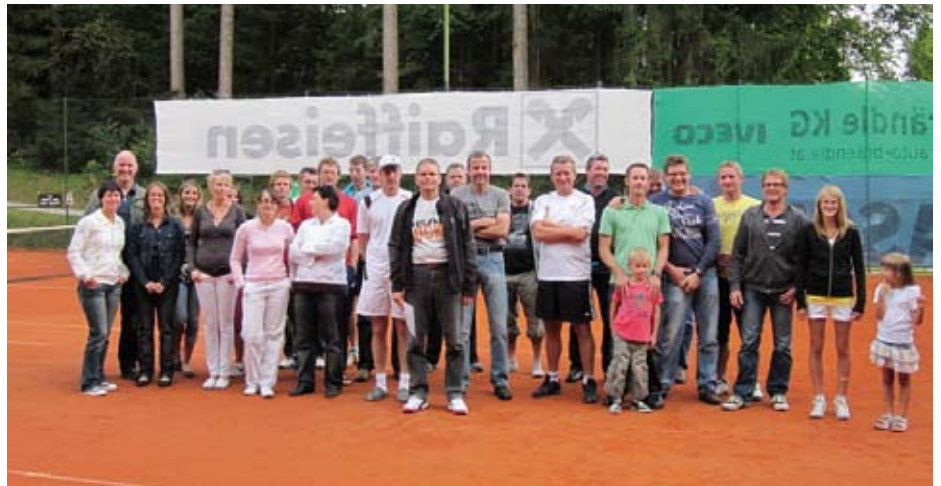
Gruppenfoto der MeisterschaftsteilnehmerInnen