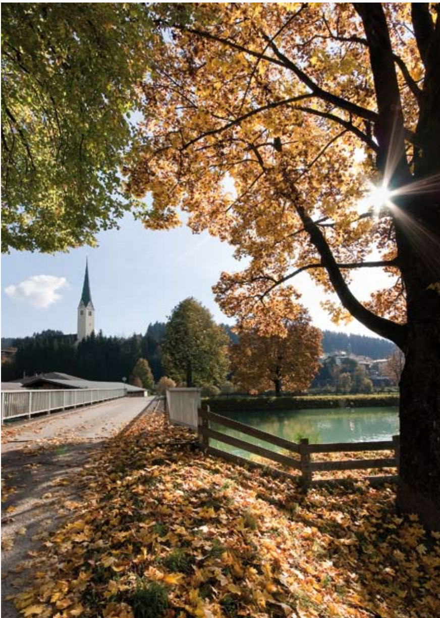
HERBSTSTIMMUNG AM KIRCHBICHLER TIWAG-KANAL

DAS INFORMATIONSBLATT DER GEMEINDE KIRCHBICHL