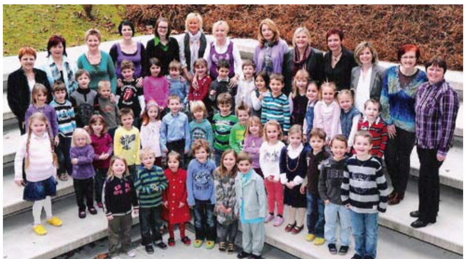
Das Team des Kiga-Kundl

Wir wünschen allen einen guten Start und viel Erfolg in der Schule.