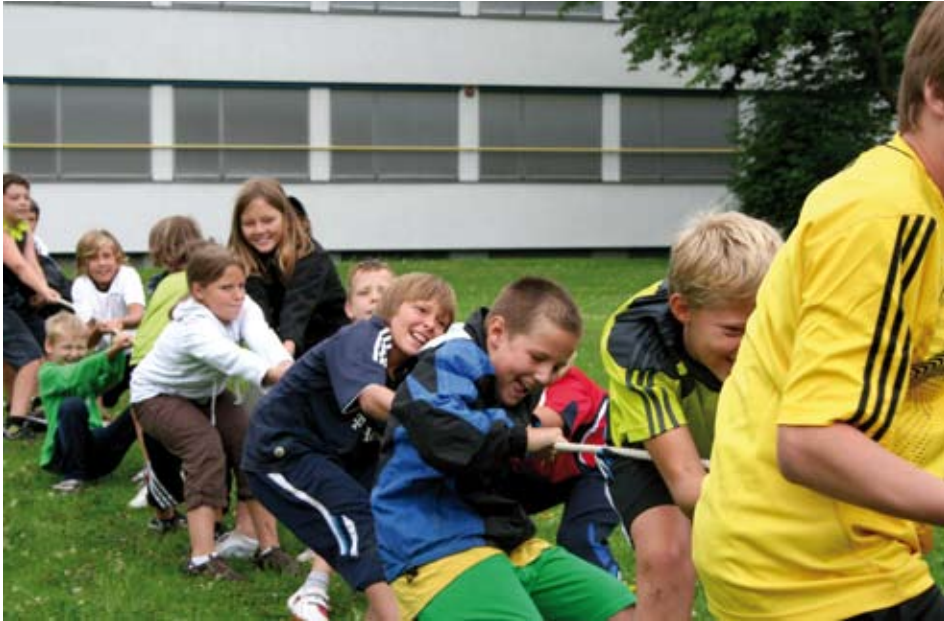
Ausgelassene Stimmung bei der Spielwoche

Eine gute Gelegenheit, den Leichtathletiksport Kundler Kindern vorzustellen, war die Mitwirkung bei der Spielwoche Ende Juli.