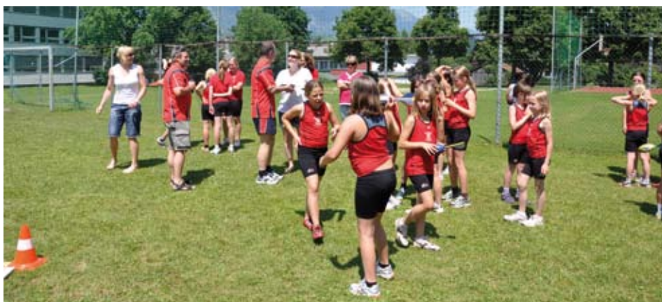
Reges Treiben bei der Vereinsmeisterschaft 2010

Im dicht gedrängten Programm des Juni war dann noch die Vereinsmeisterschaft auszutragen. Unsere Athletinnen und Athleten waren bei Traumwetter fast vollzählig angetreten. Mit Stolz zeigten die Kinder den zahlreich erschienen Eltern und