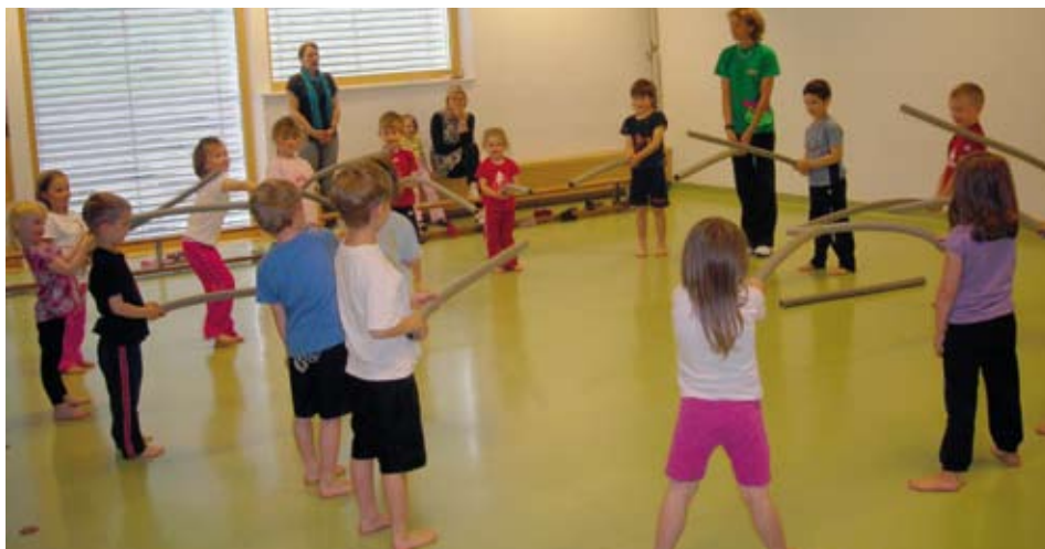
Bewegung macht einfach Spaß

Zweimal im Jahr luden uns die Mitarbeiter des ASKÖ zu eine Turnstunde mit „Hopsi Hopper“ ein.