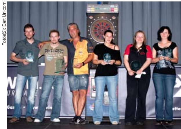
Die Sieger des Kundler Dart-Turniers

Nabezu 100 (!) Dartbegeisterte aus Nab und Fern folgten der Einladung des DC Unicorn und waren vom Ambiente im Gemeindesaal angetan.