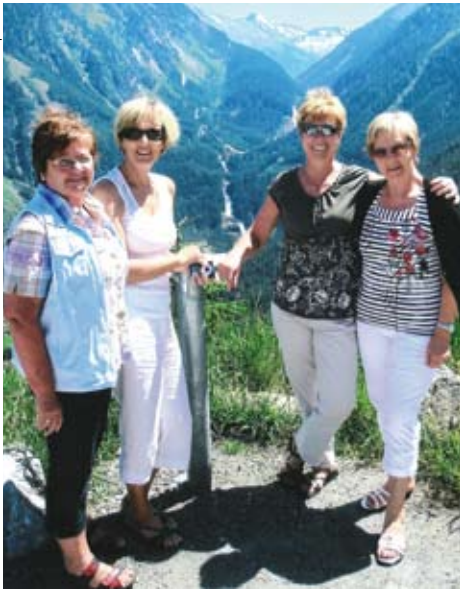
Vier fescche Kundler Jungseniorinnen

Die Kundler Ortsgruppe des Tiroler Seniorenbundes besuchte auf ihrer 3. Ausflugsfahrt die weltbekannten Krimmler Wasserfälle.