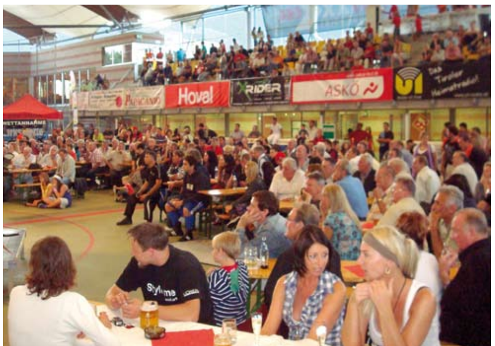
Tolle Kulisse in der Kundler Eishalle