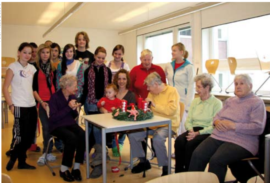
Stolz auf das Ergebnis

Nicht Deutsch und auch nicht Mathematik stand kürzlich auf dem Stundenplan der Schülerinnen und Schüler der 4a der Hauptschule Kundl, sondern gemeinsames Adventkranzbinden mit Bewohner/Innen des Alten- und Pflegeheimes Kundl.