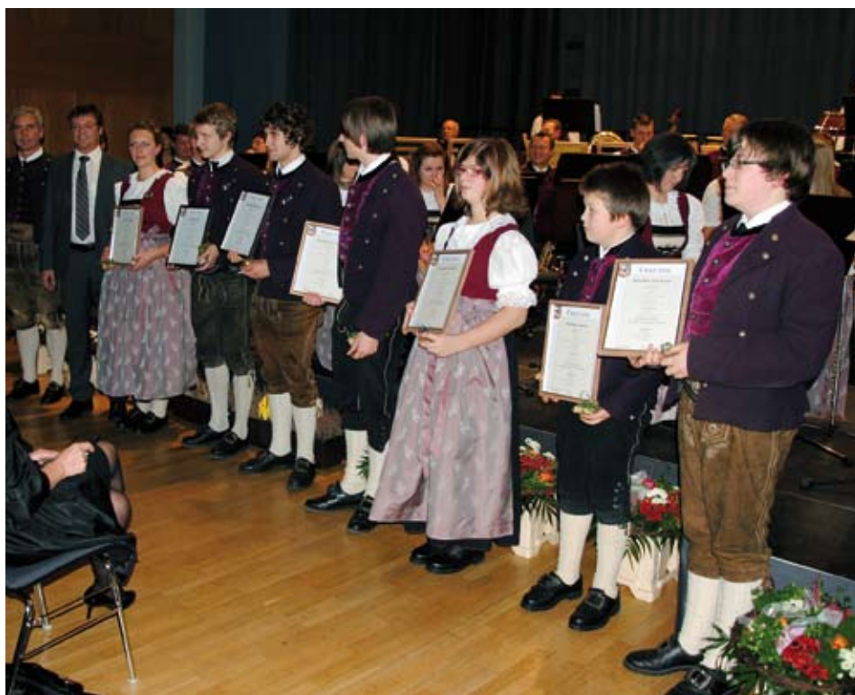
Die geehrten Jungmusikanten