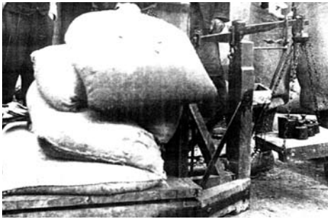
Was wurde mit dieser Waage gewogen?

Der Kalender „Kundl Seinerzeit 2011“ beantwortet diese und noch mehr Fragen. Er ermöglicht wieder einen Blick in die Vergangenheit, bringt viele nicht mehr bekannte Details, Geschichten und Geschichterl, versehen mit bisher unveröffentlichten Bildern aus Kundl, wie es früher war. Er ist zum unveränderten Preis von Euro 15,- wieder bei den Kundler Banken erhältlich.