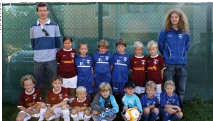
Tolle Fortschritte zeigte die Mannschaft U8

Starke Leistungen zeigte die Nachwuchsabteilung des SC Holz Pfeifer Kundl in der Spielgemeinschaft mit dem SV Breitenbach.