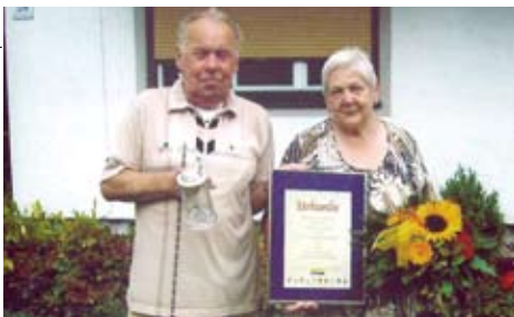
Langjährige Gäste in Kundl

Auch heuer gab es wieder Gäste- ebrungen in Kundl, wobei wir uns für die jahrelange Treue bedanken möchten.