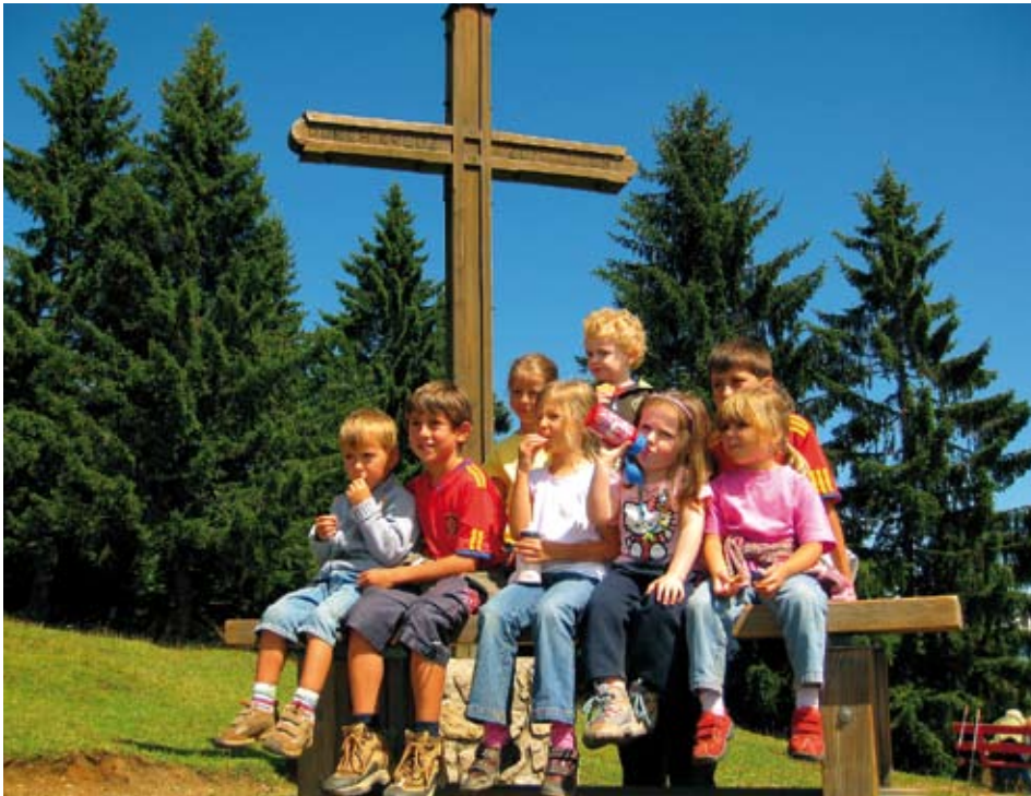
Gipfelsieg der Familiengruppe am Kragenjoch

Der Sommer neigt sich dem Ende zu und der Winter steht vor der Tür. Also ein guter Zeitpunkt für einen kurzen Rückblick bzw. einer kleinen Vorschau auf zukünftige Aktivitäten des Österreichischen Alpenvereins.