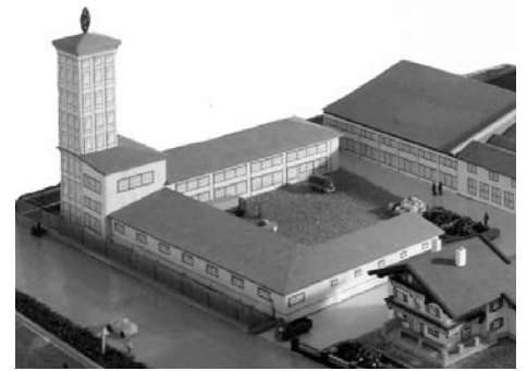
Wurde der Turm dieses Modells realisiert?

Viele Kundler sammeln diese Kalender bereits. Außerdem eignet sich der Kalender hervorragend als kleines Geschenk für Jung und Alt, für Einwohner und speziell für Kundler, welche auswärts eine neue Heimat gefunden haben. Für diese Ex-Kundler ist der Kundl-Seinerzeit-Kalender ein schönes Bindeglied zu ihrem alten Heimatort.