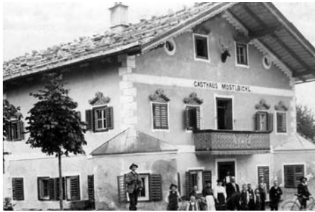
Gasthof Mostlbichl – in Kundl?

Der Kalender „Kundl Seinerzeit 2011“ beantwortet diese und noch mehr Fragen. Er ermöglicht wieder einen Blick in die Vergangenheit, bringt viele nicht mehr bekannte Details, Geschichten und Geschichterl, versehen mit bisher unveröffentlichten Bildern aus Kundl, wie es früher war. Er ist zum unveränderten Preis von Euro 15,- wieder bei den Kundler Banken erhältlich.