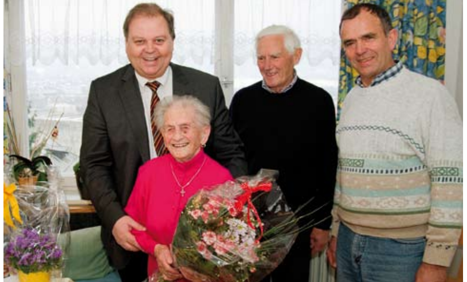
Die älteste Kirchbichlerin im Kreise der Gratulanten