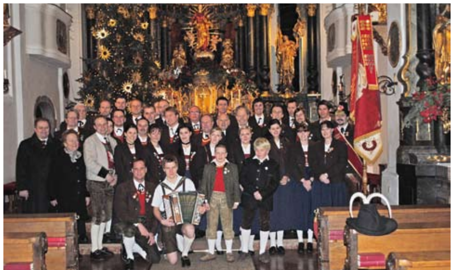
Die Mitglieder des Trachtenvereins mit den Ehrengästen nach dem Dankgottesdienst

Die Gemeindvertreter lobten die Trachtler für ihre verlässliche Teilnahme an den örtlichen Veranstaltungen und sicherte ihre tatkräftige Unterstützung bei den Jubiläumsveranstaltungen zu.