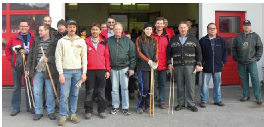
Ein Teil der fleißigen Müllsammler vor dem Feuerwehrhaus Kirchbichl

Aus diesem Grunde möchte die Gemeinde an die Vernunft alle jener