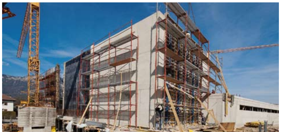
Der Bau der neuen Hauptschul-Turnhalle schreitet voran

Für den Inhalt verantwortlich Bgm. Herbert Rieder