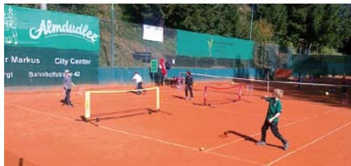
Das Tennistraining bereitet dem Nachwuchs sehr viel Spaß

Jede Dame kann mitmachen – unabhängig vom Können! Gespielt wird auf Zeit. Die Partnerinnen werden zusammengelost.