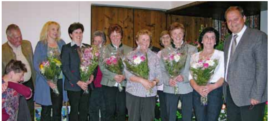
Die Gewinnerinnen der Kategorie Bauernhöfe