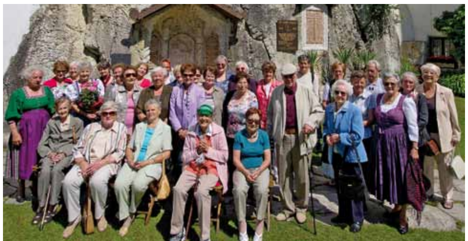
Die aktiven Turnerinnen