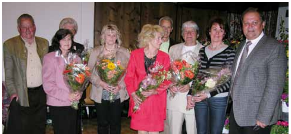
Siegerfoto in der Kategorie Wohnhäuser