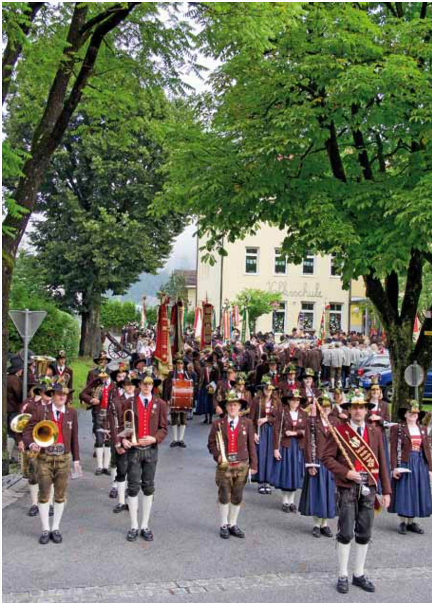
FARBENPRÄCHTIGER UMZUG ANLÄSSLICH DES 90-JÄHRIGEN BESTEHENS DES TRACHTENVEREINS KIRCHBICHL

DAS INFORMATIONSBLATT DER GEMEINDE KIRCHBICHL