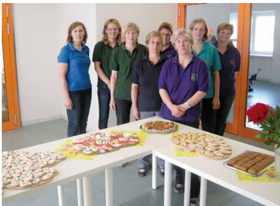
Gesunde Köstlichkeiten gab's von den fleißigen Bäuerinnen

Übrigens: Die Wörgler Bäuerinnen und der Lebensmittelmarkt Billa stellen alles kostenlos zur Verfügung. Ein großes und aufrichtiges DANKE an alle!