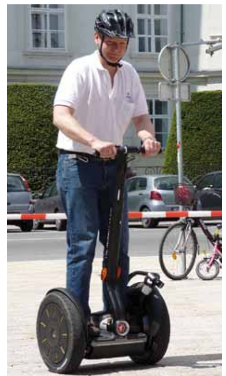
Probefahrt mit einem Segway gefällig?

Eine ausführliche Info mit dem genauen Tagesablauf samt den Beginnzeiten der diversen Vorträge wird noch mittels separater Postwurfsendung rechtzeitig an unsere Bevölkerung ergehen.