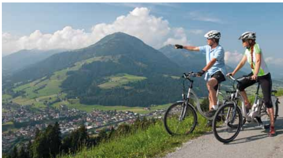
Mit dem E-Bike unterwegs zu den schönsten Aussichtsplätzen der Ferienregion Hohe Salve

Es fehlt ihnen etwas an Kondition und sie möchten trotzdem die Tiroler Bergwelt in vollen Zügen genießen? In der Ferienregion Hohe Salve ist das kein Problem! Biken muss nicht immer gleich anstrengend sein. Lassen sie sich bei Bedarf ganz einfach von einem Elektromotor am Bike unterstützen, falls es zu steil wird. Die ausgeklügelte Technik des E-Bikes unterstützt ihre natürliche Tretbewegung und setzt vor allem dann ein, wenn die physischen Kräfte schwinden. Ab dem Sommer 2010 ist die Ferienregion Hohe Salve eine Movelo-Region. Ein Netz aus 9 Verleih- und 7 Akkuladestationen garantiert ihnen hier ein grenzenloses Bikevergnügen