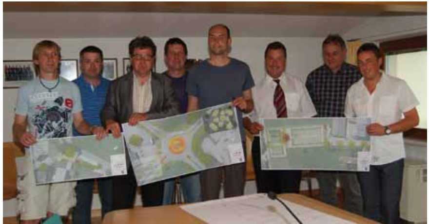
Erste Pläne für eine Verschönerung der Gemeinde wurden von den Frei- und Grünlandkonzept-Mitarbeitern erstellt und dem Ausschuss vorgelegt.

Die beiden Beamten von der Abteilung Frei- und Grünlandkonzept gaben zudem den Rat, dass in Oberlangkampfen der Brunnen bei der Jubiläumseiche so hingestellt werden sollte, dass sich aus der Eiche, dem Brunnen und dem