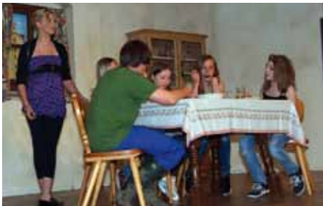
Die Ansichten gingen auseinander, wie ein Tag für die Mutter gestaltet werden soll.

Traditionell veranstaltete die Gemeinde zusammen mit der Volksbühne Langkampfen wieder eine Muttertagsfeier im Gemeindesaal. Natürlich waren auch jede Menge Väter und Kinder dabei und alle zusammen konnten sich an den lustigen Sketches erfreuen.