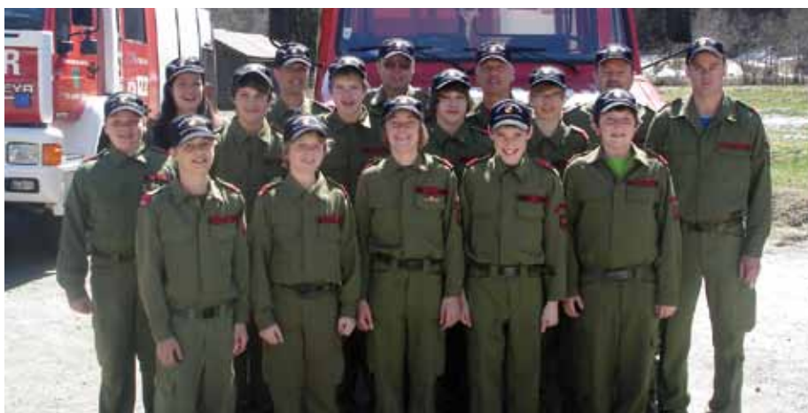
Die jungen Feuerwehrmänner beim Wissenstest in Osttirol