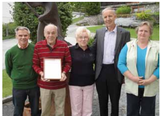
Ehrung für langjährige Langkampfen-Urlauber