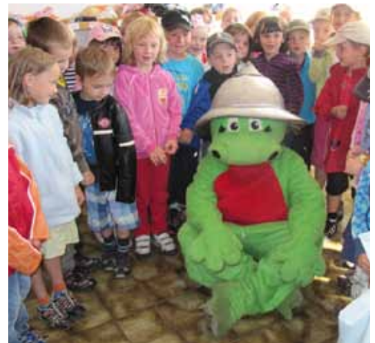
Die Kleinen waren von „Flori“, seinen Darbietungen und Künsten begeistert.

Am Vormittag des 21. Juni besuchte „Flori“, das Feuerwehrmaskottchen, mit 39 Kindern samt Begleitpersonen aus dem Kindergarten Unterlangkampfen die FF Unterlangkampfen. Flori begleitete die Kinder zum Gerätehaus wo sie nach der kurzen Wanderung mit einer gesunden Jause empfangen wurden. Anschließend wurde ihnen altersgerecht die Ausrüstung eines Feuerwehrmannes/frau, einzelne Gerätschaften und die Einsatzfahrzeuge gezeigt. Unter Anleitung von „Flori“ durften die Kleinen auch das Spritzen mit dem Feuerwehrschauch versuchen. Abschluss des Vormittages war die Rückfahrt zum Kindergarten mit den Einsatzfahrzeugen – auch hier war „Flori“ dabei. Davon waren die Kinder natürlich begeistert.