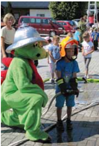
Mit „Flori“ an der Feuerwehrspritze - das war ein Erlebnis.

Am Vormittag des 21. Juni besuchte „Flori“, das Feuerwehrmaskottchen, mit 39 Kindern samt Begleitpersonen aus dem Kindergarten Unterlangkampfen die FF Unterlangkampfen. Flori begleitete die Kinder zum Gerätehaus wo sie nach der kurzen Wanderung mit einer gesunden Jause empfangen wurden. Anschließend wurde ihnen altersgerecht die Ausrüstung eines Feuerwehrmannes/frau, einzelne Gerätschaften und die Einsatzfahrzeuge gezeigt. Unter Anleitung von „Flori“ durften die Kleinen auch das Spritzen mit dem Feuerwehrschauch versuchen. Abschluss des Vormittages war die Rückfahrt zum Kindergarten mit den Einsatzfahrzeugen – auch hier war „Flori“ dabei. Davon waren die Kinder natürlich begeistert.