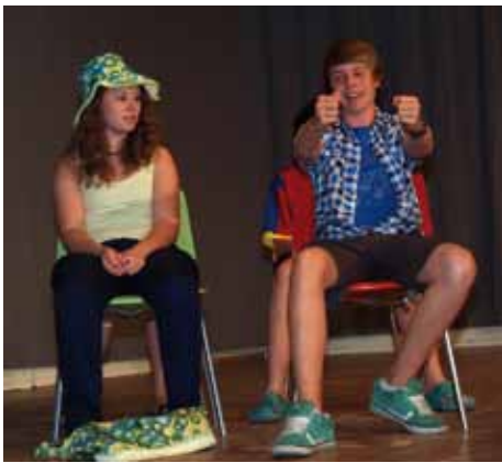
Bei so einem Familienausflug kann es ordentlich rund gehen.