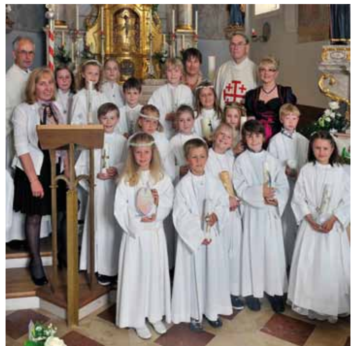
Die Erstkommunikanten von der VS Oberlangkampfen.