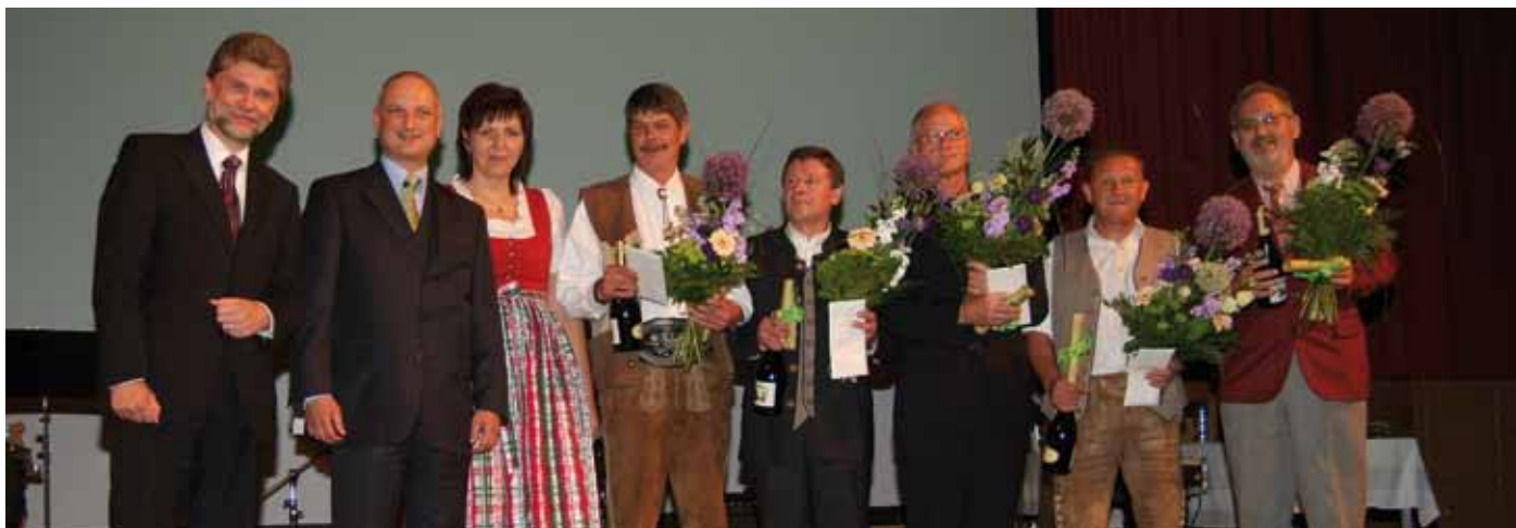
Ehrung langjähriger Mitarbeiter im Rahmen der 30-Jahr-Feier der Firma Viking in der Arena Kufstein.

In drei Segmenten brachte Viking in jüngster Vergangenheit Produktneheiten auf den Markt: bei den Motorhacken, den Rasenmähern und den Reitermähern. Alle drei Produkte haben auch bereits entsprechende Design-Preise gewonnen, bzw. wurde die Motorhacke mit dem Staatspreis für „Vorbildliche Verpackung 2010“ ausgezeichnet.