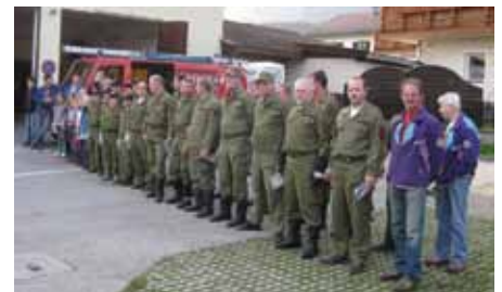
Frühjahrsputz durch die Feuerwehrleute im ganzen Dorf.