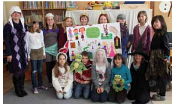
Die Volksschüler als Märchenprinzen, Räuber und Froschkönig.

Märchentanten“ mit den Kindern durch die Welt der Gebrüder Grimm. Es wurde gebastelt, gesungen und gekocht. Am Ende entstand daraus ein Märchenbuch, in dem all die schönen Momente festgehalten wurden.