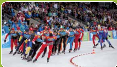
Massenstart 5 000 m