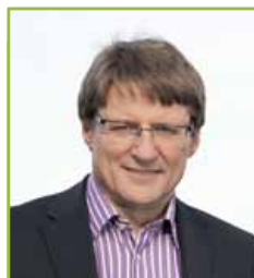
Hannes Gschwentner Landeshauptmann- stellvertreter

Den Sportlerinnen und Sportlern wünsche ich dass ihre Trainingsanstrengungen den gewünschten Erfolg bringen, vor allem aber eine unfallfreie Rennsaison.