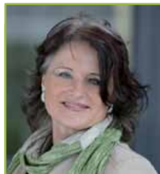
Hedi Wechner Bürgermeisterin der Stadt Wörgl