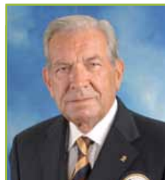
UMBERTO URBINATI President of the European Speed Skating Committee

Ich wünsche allen Teilnehmern viel Erfolg und schöne Tage in Wörgl.