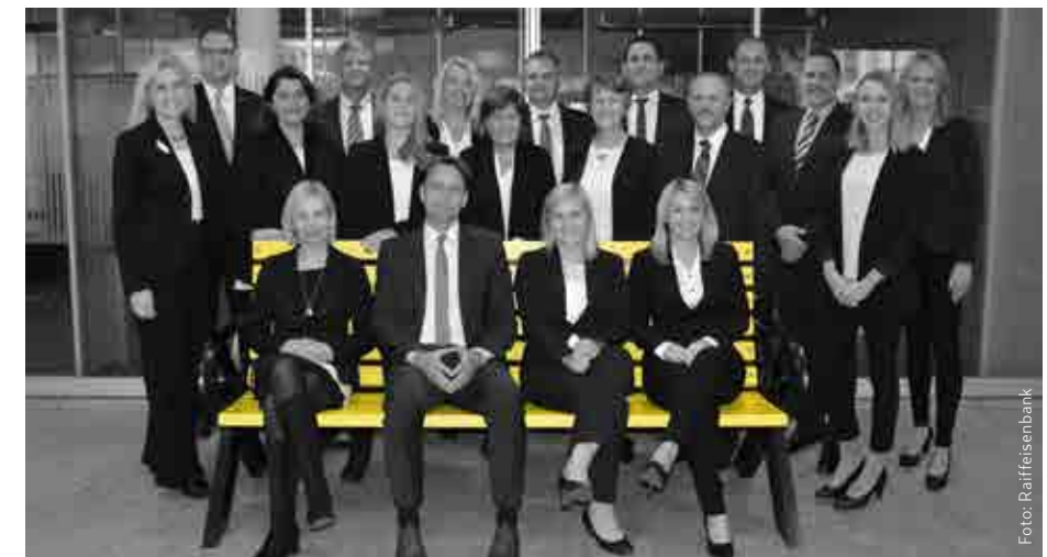
▲ Kommen Sie vorbei und überzeugen Sie sich von der Kompetenz und Servicequalität: Das Team der Raiffeisenbank in Wörgl freut sich auf Ihren Besuch!

nungszeiten, vereinbart werden. www.rbk.at Werbung