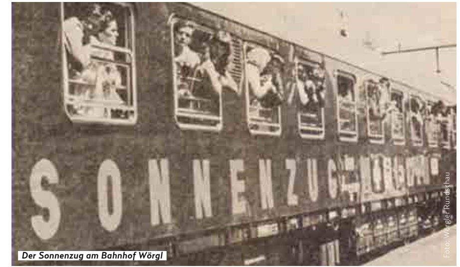
Der Sonnenzug am Bahnhof Wörgl