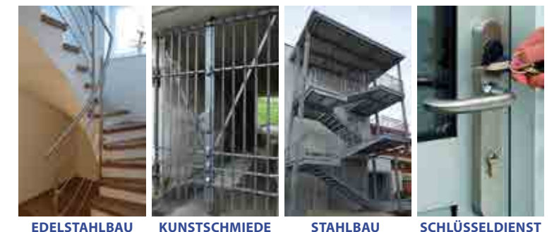
EDELSTAHLBAU KUNSTSCHMIEDE STAHLBAU SCHLÜSSELDIENST