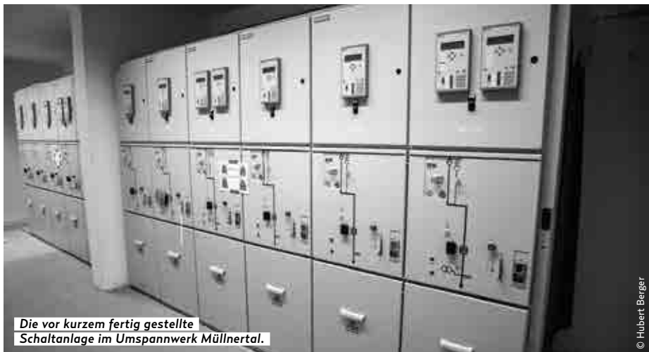
Die vor kurzem fertig gestellte Schaltanlage im Umspannwerk Müllnertal.

Eine besondere Herausforderung ist, dass diese Bauarbeiten bei laufendem Betrieb durchgeführt werden. Letztendlich zählt das Umspannwerk Müllnertal zu den Knotenpunkten im gesamten Stadtwerke Wörgl-Stromnetz.